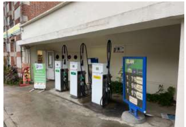
Nouvelles pompes et pupitre de commande aidés par le Département et Val de Sully