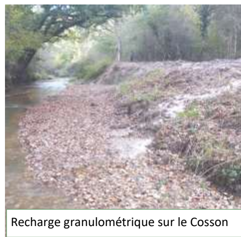
Recharge granulométrique sur le Cosson