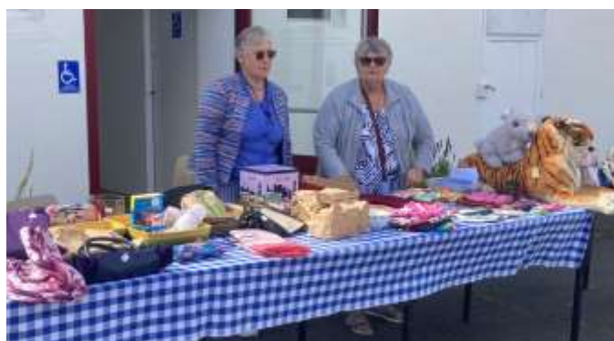
De belles créations présentées lors du vide grenier