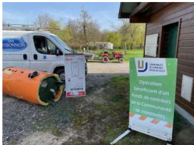
Bloc sanitaire camping

Comme indiqué précédemment (cf Finances Communales), la Commune a été largement accompagnée dans ces travaux par les instances 'supérieures', d'où les photos qui font aussi état de ces bienfaiteurs.