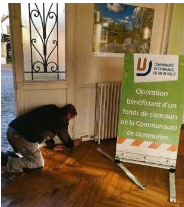
Salle du Conseil (réseau de chauffage) : remplacement de tuyauteries percées sous le parquet au passage des portes ; le parquet sera remis en état en 2025