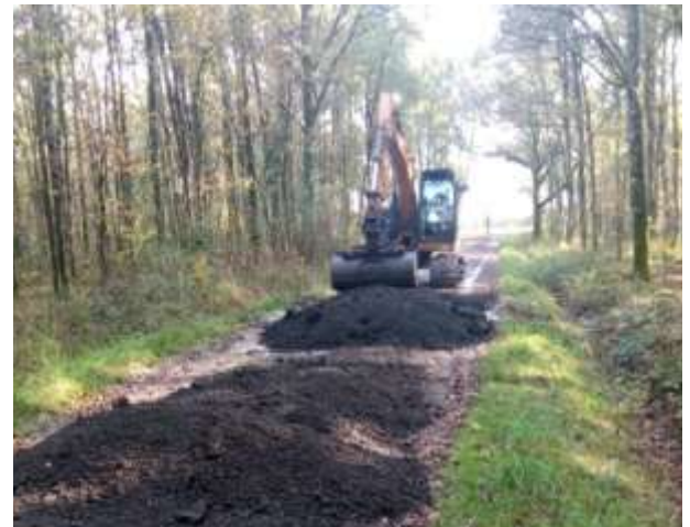
Chaque année il est important de reboucher les trous dans les chemins et voies communales grâce à l'apport de matériaux et l'utilisation d'une dameuse