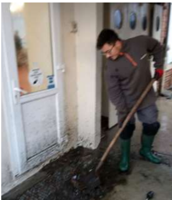
Rénovation de la station d'essence, devant la porte de l'épicerie, par Thoma