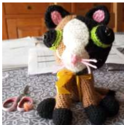
Un compagnon tout doux, sorti tout droit de doigts agiles