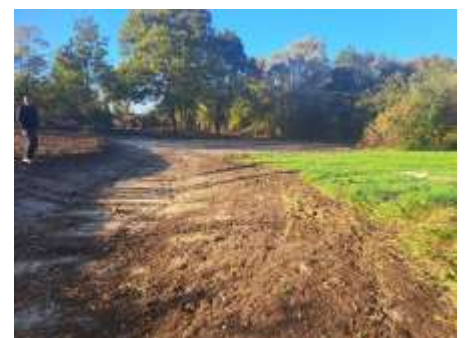
Zone décaissée qui deviendra une zone humide à Chitenay

Noue permettant l'alimentation de la zone décaissée qui deviendra une zone humide à Chitenay