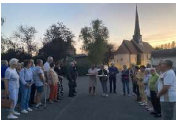
Arrivée attendue des 'Tartes Tatin'

Une belle soirée d'échanges et d'amitiés avec une dégustation de délicieuses 'Tartes TATIN' préparées par THARANI l'épicier du village.