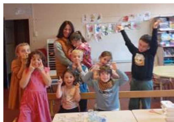
Galette des rois, goûter de fête, tapis de jeu et créations multiples....