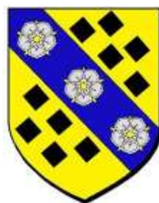
Blason de la famille de GILLY