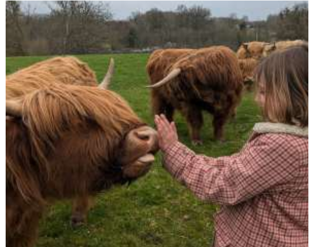
En attendant les joueurs