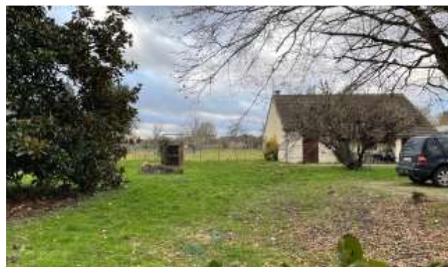
Maison du « 5 rue Vieille »

Les dépenses d'Eau : on mesure une baisse régulière des consommations dans le village et des pertes en lignes, malgré des comptages encore incomplets dans certains bâtiments communaux dont la consommation apparaît en 'perte'. Ces baisses entraînent une réduction bienvenue des prélèvements dans la nappe phréatique. De bonne augure pour la réserve d'eau potable. Il reste toutefois des risques d'augmentation des tarifs dans les prochaines années en cas de centralisation de la gestion au niveau de l'Intercommunalité !