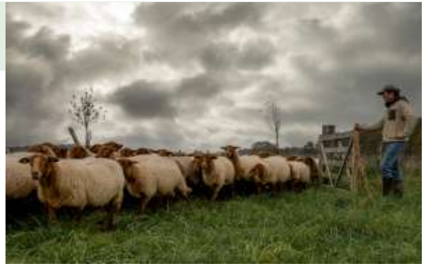
Vacances à la Ferme : un nouvel ami

Contact : fermedupoirier.sologne@gmail.com www.fermedupoirier.com