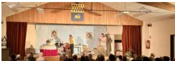
2022 : « J' suis, j'y reste »

Invités par le Comité de Jumelage , Ils ont présenté à Isdes deux pièces : "J'y suis...j'y reste" en 2022 et "Tout le plaisir est pour nous" l'an dernier. Très gros succès auprès du public.