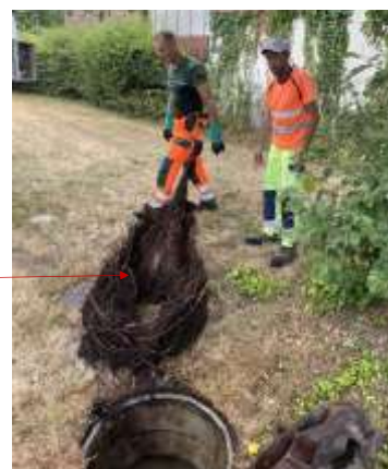
La 'Forêt' de racines !!

Suite à des problèmes d'évacuations, il a été nécessaires de contrôler l'ensemble du réseau (opération qui n'avait pas été faite depuis bien des années) : il en est ressorti une véritable forêt de racines qui obstruait les évacuations .