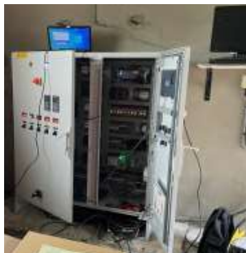
Nouvelle armoire en cours d'installation