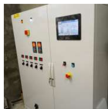
Nouvelle armoire installée