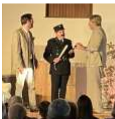
2024 : « Tout le plaisir est pour nous »

Contact : Alain Leboulanger : 06 88 10 15 55 aleboula@online.fr